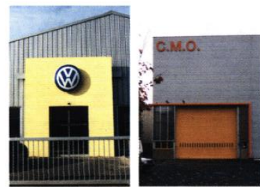
▲ L'enseigne donne le nom de l'entreprise et dialogue avec l'architecture du bâtiment. Exemples de positionnements stratégiques.

En général, une seule enseigne par façade: le nom de l'entreprise et sa qualification ou son domaine d'exercice. Les enseignes à vocation publicitaire sur les produits commercialisés par l'entreprise sont à proscrire.