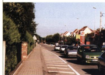
▲ La rue du Maréchal Juin

La voiture est dominante, les traitements des espaces renforcent sa présence: route surdimensionnée accentuant l'effet de coupure, traversée piétonne souterraine ou en surface problématique, cheminements peu agréables, impact visuel fort des parkings.