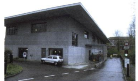
▲ La cour de service et les aires de déchargement sont intégrées à l'architecture du bâtiment