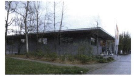
▲ Le supermarché s'est implanté en maintenant sur l'un de ses côtés un écran de nature.