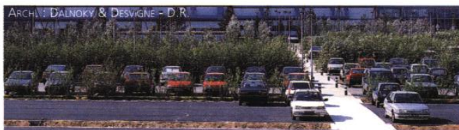
▲ Des végétaux fragmentent l'aire de stationnement en compartiments, améliorant ainsi son insertion paysagère. Un cheminement, séparé du parcours voiture, conduit en toute sécurité le visiteur vers l'entrée du bâtiment.