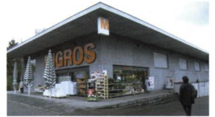
▲ Un large débord de toiture protège l'entrée du magasin et souligne l'enseigne.