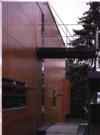
◀ Façade en panneau d'okoumé

5, RUE HANNONG 67000 STRASBOURG TEL. 03 88 15 02 30