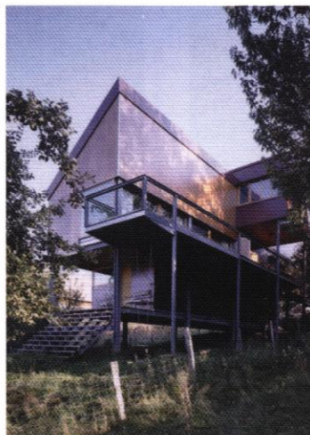
▼ Structure acier galvanisé, panneaux en contre-plaqué