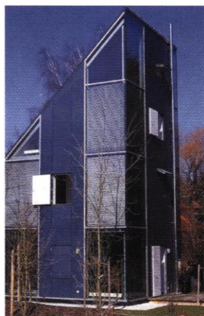
▲ Panneaux de contreplaqué replaqué en pin