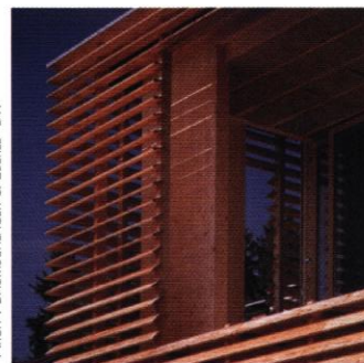
ARCH : BAUMSCHLAGER & EBERLE - DR

Si le bois présente une simplicité d'aspect, ses détails de mise en œuvre offrent à l'architecture de la maison en bois une esthétique fine et élaborée : sens de pose, traitement des coupes et des assemblages, profil des sections, rythmes ou espacements des lattes, ... sont autant de dispositifs qui contribuent à la richesse d'aspect de la construction bois.