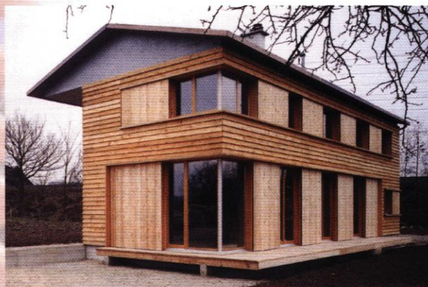
ARCH : STEIMANN & SCHMID