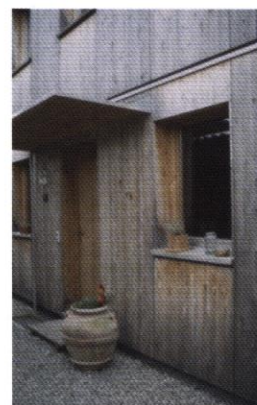
▲ Mélèze non traité