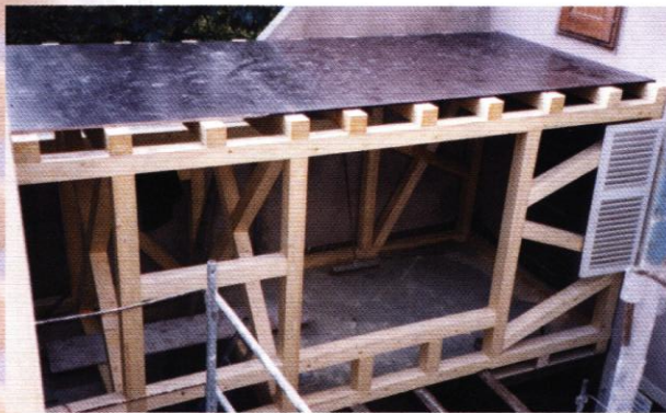
ARCH : AUBISSE & KEMPF

Les éléments d'une construction bois sont fabriqués en atelier avant d'être assemblés sur le chantier. Cette technique constructive garantit une mise en œuvre précise et un montage rapide sur le terrain. Elle peut permettre de réaliser des chantiers difficiles d'accès.