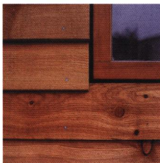
◀ Clins de bois lasurés