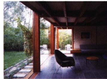
ARCH : HERZOG - DR

Qu'il soit utilisé comme enveloppe ou comme structure, le bois participe très simplement à la fabrication de l'ambiance des espaces de la maison et ne nécessite pas de matériaux de décor ou de finition supplémentaires.