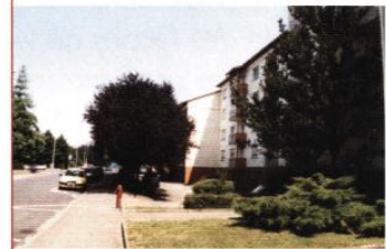
◀ Rue des Champs Verts

Ce secteur, constitué d'immeubles d'habitation, s'est organisé le long de l'avenue des Champs Verts et marque la limite provisoire de l'urbanisation de la ville. Le développement futur de la Décapole, sur sa limite Est, pourrait permettre de remédier à des arrières difficiles, en repensant notamment la gestion du stationnement et l'aménagement des espaces extérieurs.