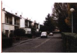
▲ Square Saint-Charles

La rue des Bruyères et le square Saint-Charles résultent de la réalisation de petites opérations d'habitat groupé. Ces dernières se réduisent à une ligne bâtie, fabriquant un front continu sur rue. Leur contiguïté avec des équipements de quar-