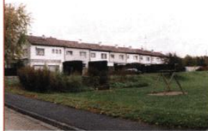
◀ Rue des Bruyères