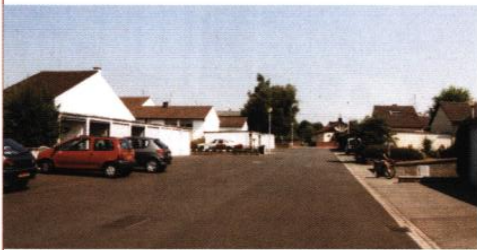
▲ La rue des Petits Champs dessert les ruelles piétonnes et rassemble les garages. Elle pourra faire l'objet d'un aménagement plus approprié à son rôle particulier.

L'ensemble des habitations est desservi par des ruelles piétonnes, rappelant les sentiers des quartiers de jardiniers. La voiture est tolérée exclusivement pour la dépose. La rue des Petits Champs organise l'accès aux ruelles et rassemble les garages de chaque habitation. Côté ruelle, un jardinet ornemental protège les maisons.