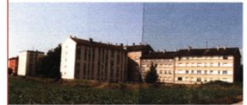
◀ L'arrière des immeubles de Champs Verts est en attente d'une fin heureuse.