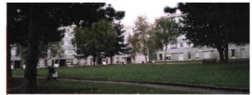
▲ Le réseau des espaces verts du secteur : un atout

tier (le groupe scolaire Europe pour le square Saint-Charles, le square du Tertre pour le lotissement des Bruyères) font d'elles des éléments importants de l'espace urbain.