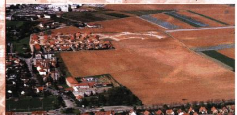
▼ L'emprise donnée au futur quartier de la Décapole

qu'aucune disposition urbaine et architecturale n'a réellement pris en compte. Les terrains se trouvent privés d'intimité et d'un environnement valorisant ; le quartier ne parvient pas à construire ses repères et son caractère. Pour les phases d'urbanisation suivantes, un projet urbain devrait préparer l'arrivée des opérations de construction et permettre de forger l'ambiance du quartier.