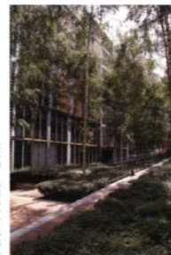
ARCH : PIANO

◀ Les petits aménagements (haies, claustras, pergolas, abris, ...) délimitent les cheminements et hiérarchisent les espaces collectifs et privés.