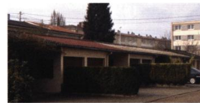
▲ arbres, haies et plantes grimpantes constituent l'avant-scène de la maison et fabriquent l'ambiance de la rue.

Soyez attentif à la qualité des espaces extérieurs : ils personnalisent la maison et participent à la qualité de la rue.