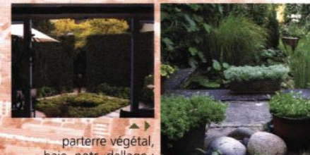
▲ parterre végétal, haie, pots, dallage : des ingrédients pour l'aménagement des jardins sur rue