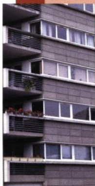
ARCH : LION - D.R.

Une amélioration du confort phonique et thermique des appartements conduit souvent à fabriquer une seconde peau à l'avant des façades anciennes. Ces travaux peuvent être l'occasion de mener un projet plus global sur la qualité des logements: en modifiant des percements, en intégrant des prolongements extérieurs nouveaux, en apportant un traitement solaire, en restructurant les circulations communes ou en apportant une pièce en plus.