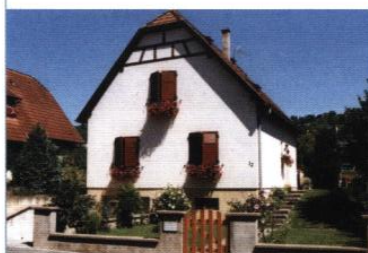
▲ maison, rue d'Oslo

FICHES : CLÔTURES ET JARDINS • ENTRETIEN SA MAISON