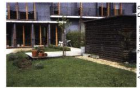
ARCH. : ZUMTHOR - D.R.

Construire une annexe pour abriter la voiture ou les outils de jardin est l'occasion de repenser l'aménagement des abords de la maison. Par une position appropriée, l'annexe peut offrir plus d'intimité au jardin ou améliorer une entrée.